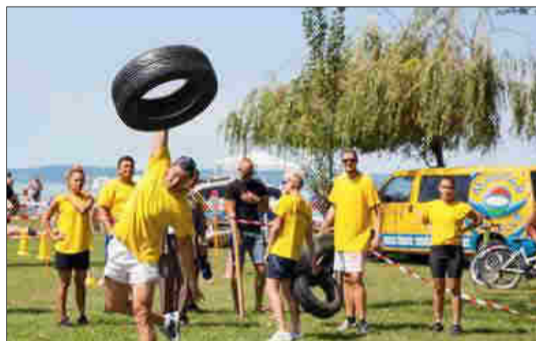
Az erős emberek évek óta itt csapnak össze egymással a Virtus-telkén