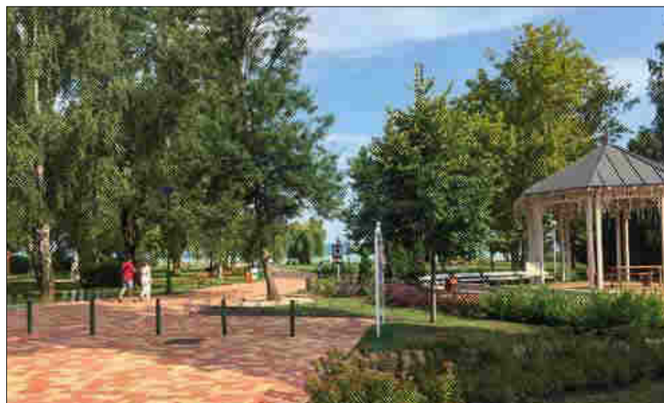
Szépen megtervezték a kövek és a színek játékát a Tó-parti sétányon. Ezt a beruházást is ünnepélyes keretek között adták át a piac avatása után.