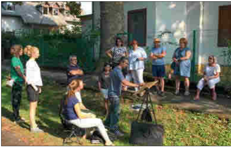
A festők csoportja és a vezető művész festménye a József Attila Emlékháznál