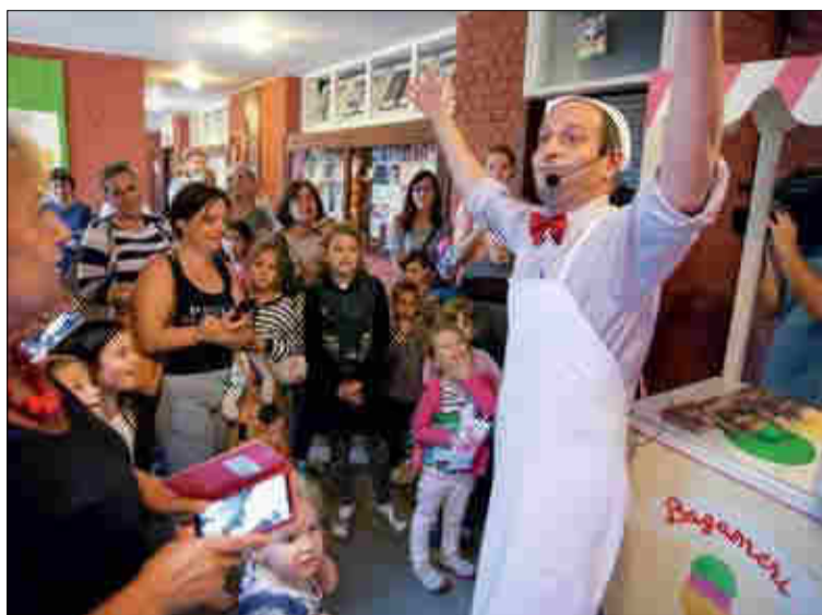
Nagy siker volt a gyerekek örök kedvence Bagaméri!