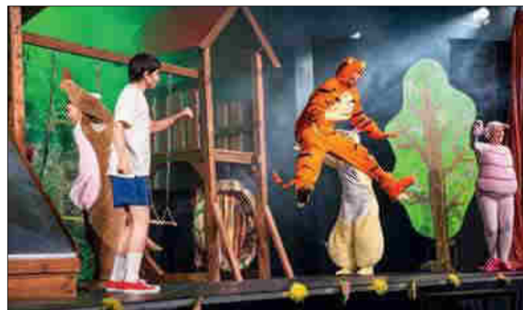
Micimackó barátja, Tigris a levegőben