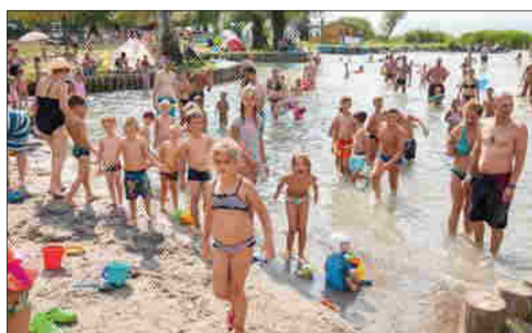
Sokszor voltunk ezerszámra a Központi strandon