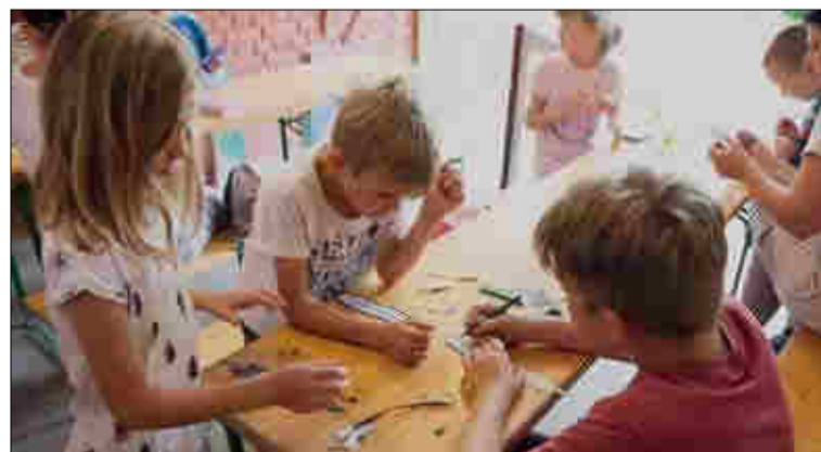
Irodalmi Mókoló a Csukás Színházban