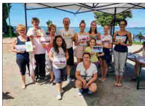
A Rajzsakkör Balaton akvarell workshopjára sokan jelentkezték.