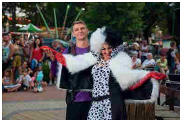
Szörnyella harci díszben a Zenepavilonnál