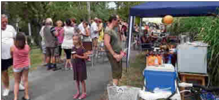
Batjus utcabál lesz jövőre is

A Kond utca és környéke üdülőtelajdonosai utcabált szerveztek július 27-én a Szongoth Család kezdeményezésére hogy ismerkedjenek, barátkozzanak. Ott volt a környék apraja-nagyja, kb. hatvanan. Az összejövetelnek batjus-bál jellege volt: enni-innivalót, asztalokat, székeket, lampiont hoztak és szolid disco zene is szólt.