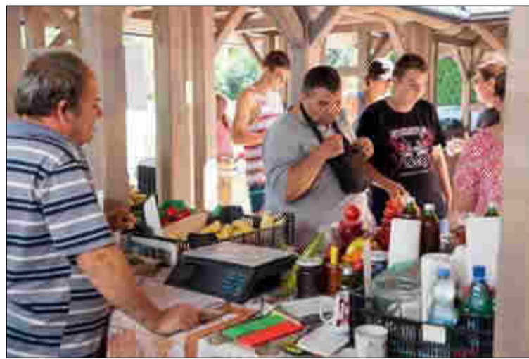
A helyi és környékbeli kistermelők csodálatos felhozatalát nagyon sok nyaraló dicsérte. Törzsvásárlóként közvetlen kapcsolatba is kerültek, és sokan előre megrendelik a másnapra való enni- vagy főzni való gyümölcsöt, zöldséget.

Mi szem-szájnak ingere minden finomság megtalálható volt a júniusban elkészült és felavatott Helyi Termelői Piacon. A legszebb portékájjal, a mindig frissen szedett zöldséggel, gyümölcssel jelentkez-