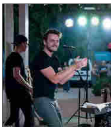
Nagy sikert aratott a Kávészünet zenekar koncertje a Zenepalonnál