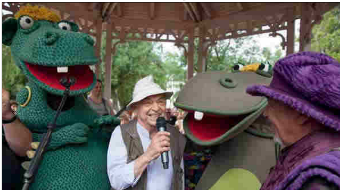
Süsü Szárszón, itt is, ott is, és szinte mindenütt. És most itt volt vele a klasszikussá vált mese-hangja is Bodrogi Gyula Kossuth díjas színművész személyében. A Sárkány fesztiválra ezrek időzítették nyaralásuk időpontját. (Nyári képriport a 4. oldalon)