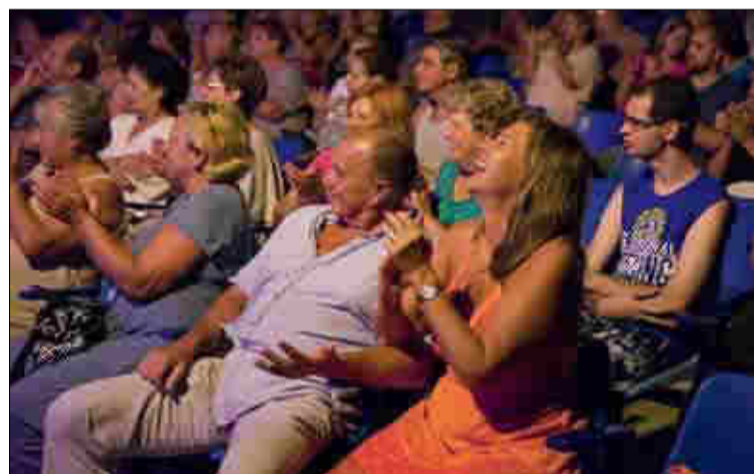
Talán magára ismert az önfeledten nevető hölgy Csányi Sándor: Hogyan értsük félre a nőket című fergeteges sikerű műsorán?