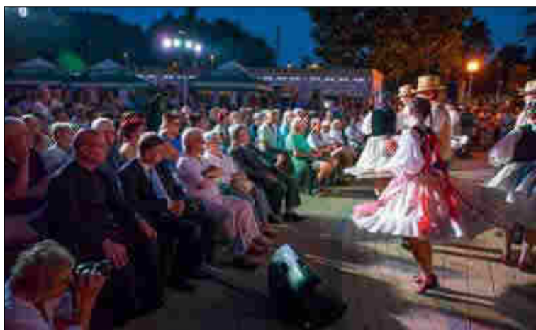
Az ünnepi műsort és az azt követő látványos tűzijátékot nagyszámú közönség nézte végig