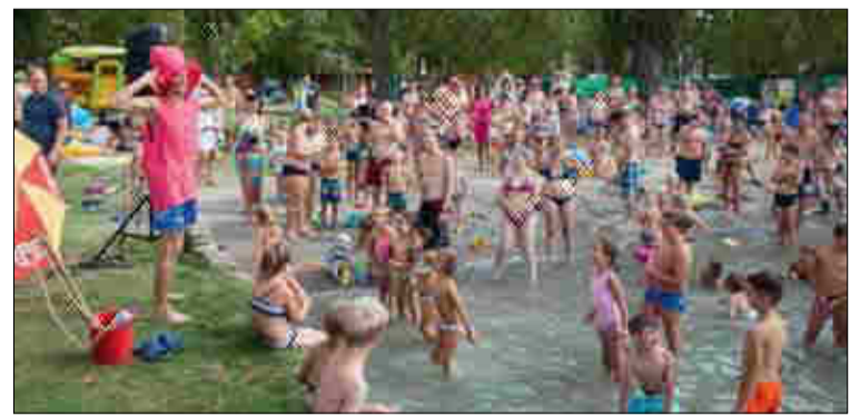
A Nagy Ho-ho-horgász itt is elvarázsolta a fürdőzőket

Augusztus 9-én nem csak a jó idő miatt telt meg zsúfolásig a központi strandunk, hanem azért is, mert egy egész napos egészség- és sportnap várta az érdeklődőket. Az elnyert pályázati pénzből megvalósuló rendezvény, színes repertoárral várta az idelátogatókat. Délután strand partyval kezdtük a napot, ahol különféle családi vízi játékokkal és vetélkedőkkel készültek a szervezők. EFI iroda közreműködésével egészségügyi méréseket és tanácsadásokat vehettek igénybe a résztvevők. Vendégünk volt Madarász Ildikó a Balaton háziaszónya, aki frissen sült sügért, lilakáposztával és Süssü-palacsintával. A délutáni sport foglalkozások is nagy népszerűségnek örvendtek a kicsik és nagyok körében egyaránt. Aqua zumba aerobic és zum-