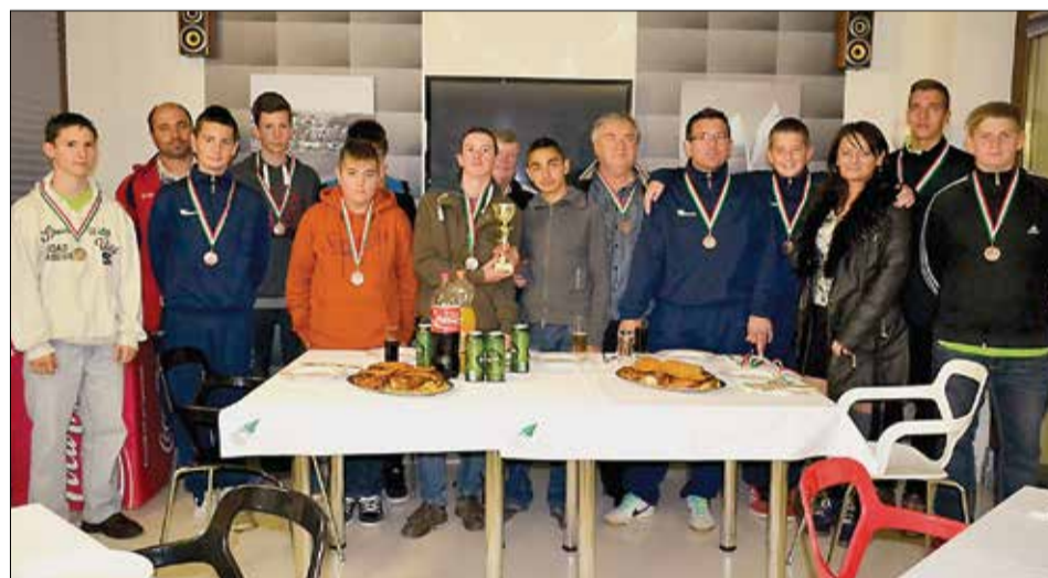
Felvételünk a serdülő csapat ünnepi éremosztóján készült