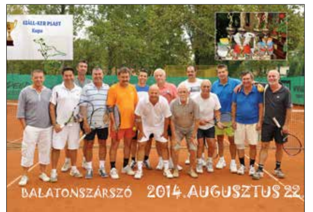
A tenisz club csapata

A klub tagjai már ötödik éve támogatják a helyi labdarúgó klub utánpótlását – eddig közel 9 millió Ft-tal!