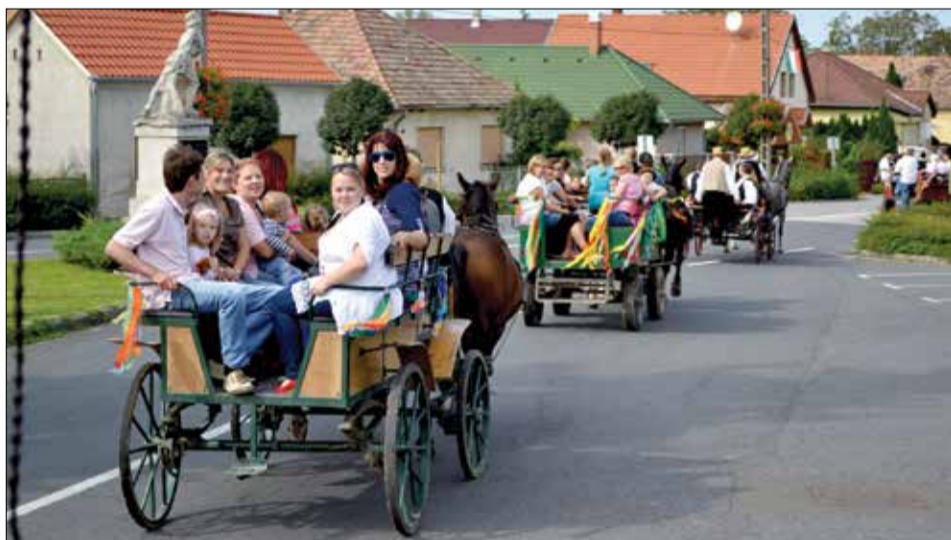
Végigvonultak Szárszón a szüreti fogatok

Már 2-3 héttel szeptember 20-a, a szüreti felvonulás napja előtt megkezdődtek az előkészületek. Elkészültek a fiú és lány bábok, amik a Művelődési Ház előtt és a Hősök terén álltak, a kocsik és lovak díszítésére szolgáló színes csokrok, szalagok, a Művelődési Ház díszbe öltöztetéséhez a papírból készült szőlőfürtök, színes díszek.