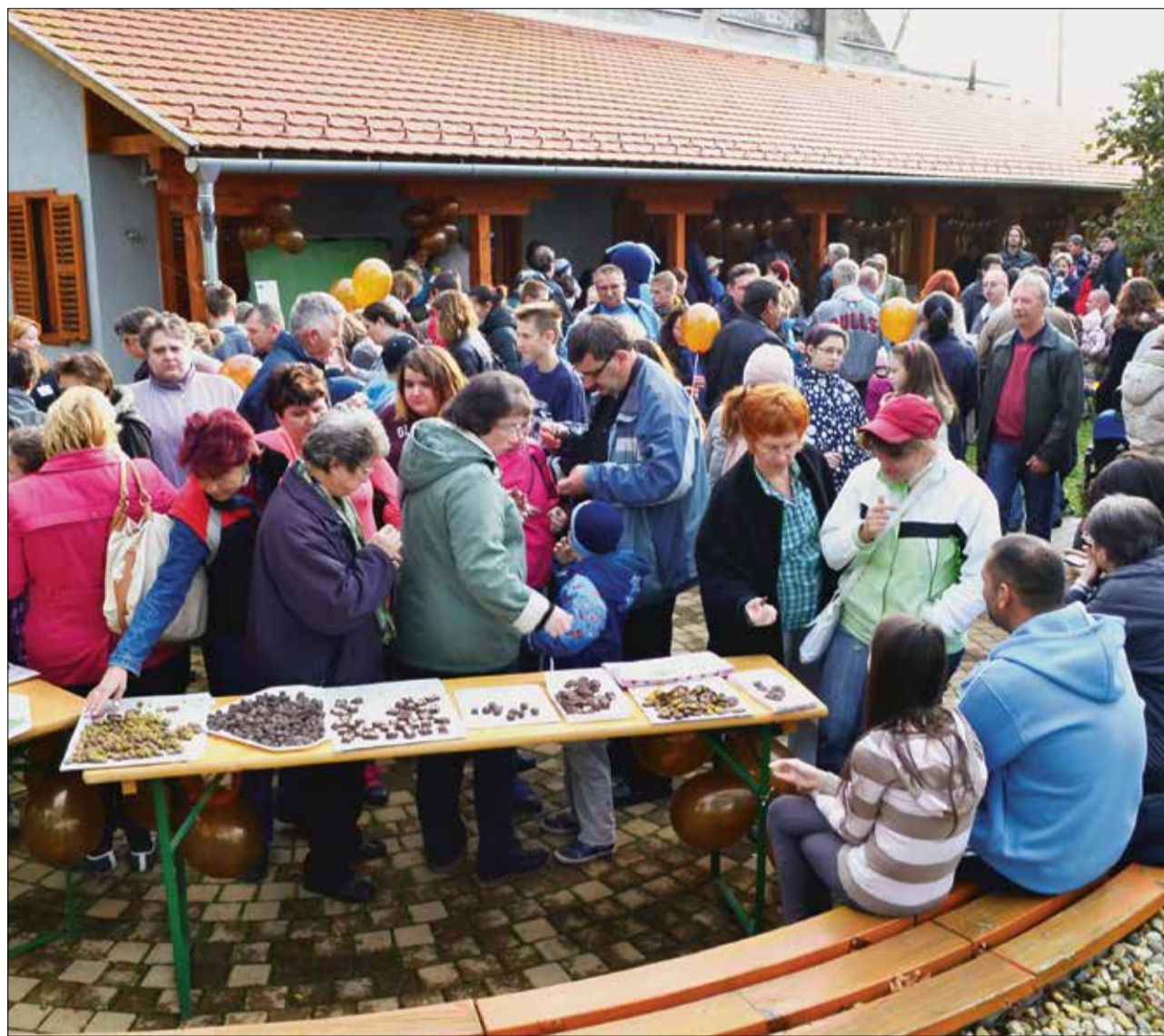
Csoko-csoko-csokoládé... minden mennyiségben. A Balatonszárszói Turisztikai Egyesület és a József Attila Emlékház közös szervezésében a Csoki-fesztivál az ingyencék napja volt.

Ilyen még nem volt! Csokifesztivál Szárszón október 24-25-én. Előző napokban 3000 bonbont sikerült készíteniük az ügyes kezű asszonyoknak a művelődési ház konyhájában. A több mint 10 féle csoki között volt mentás, mogyorós, pisztáciás, narancsos, tej-, ét-, fehér-, rumos csoki. A büfé kínálata kiegészült forrócsokoládéval, forralt borral, kávéval és csokifondüvel.