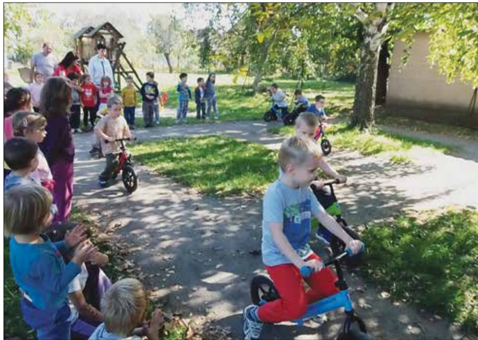
A KRESZ-szel már most ismerkedni kell

A hagyománnyá vált Mihály napi vásárunk negyedik alkalommal rendeztük meg szeptember 29-én. Már hetek óta lázas izgalommal készülünk a szülőkkel, a gyerekekkel, és az óvoda dolgozóival erre a nagy napra.