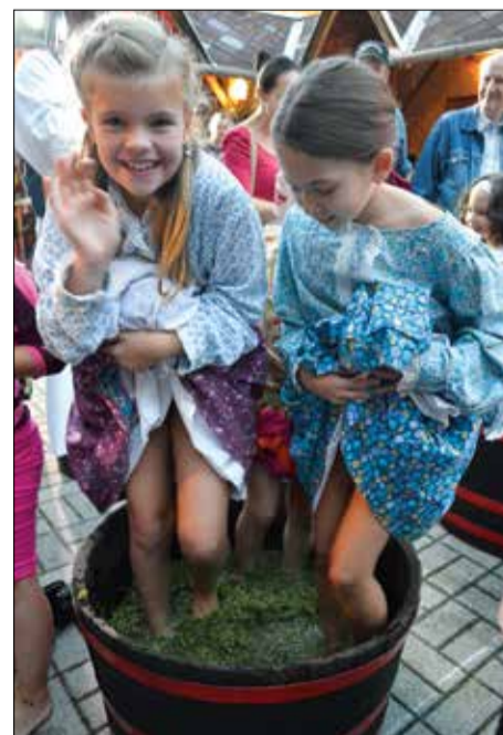
A gyerekek sorban álltak, hogy kipróbálhassák a szőlőtaposást

a Szárszó Néptáncgyűtessel tánccra perdült fiatal és idős egyaránt.