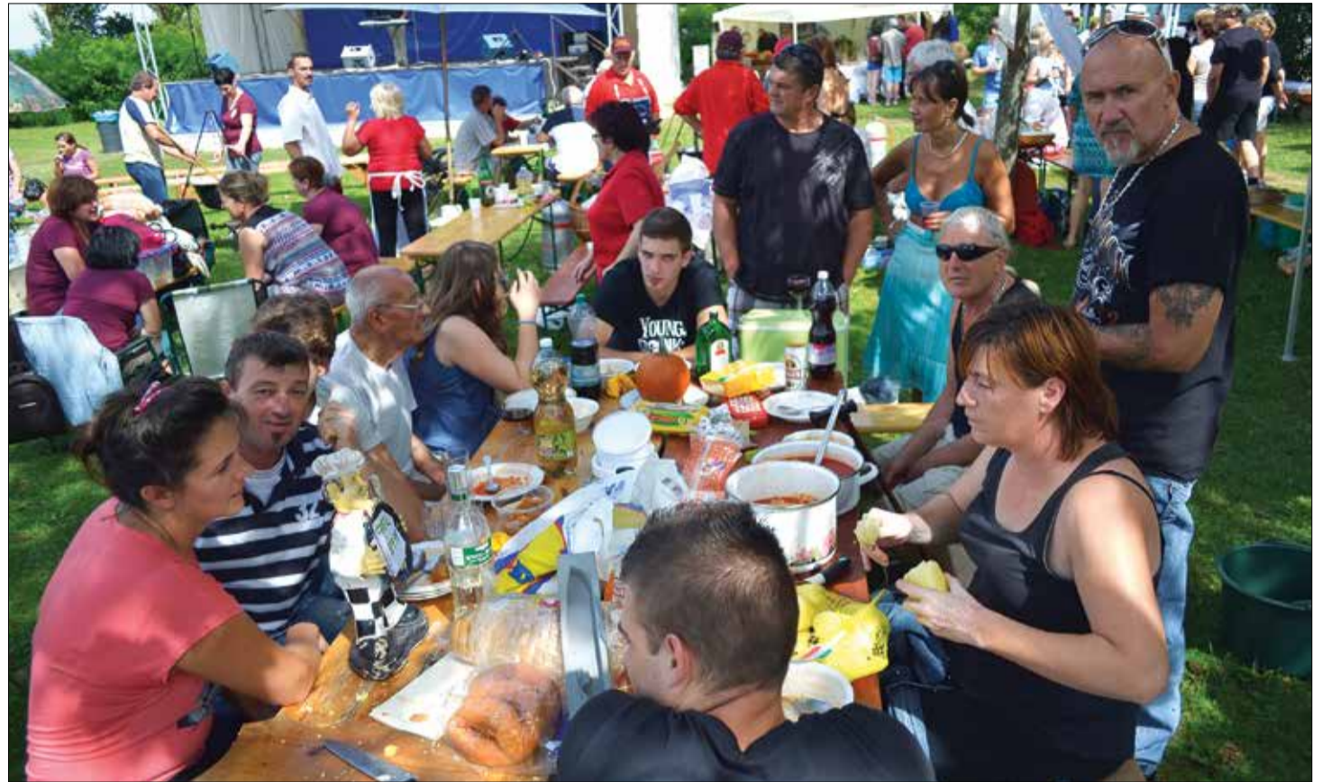
Új vendégek is jelentkeztek a lecsófőzésre, és ígérték, hogy máskor is jönnek