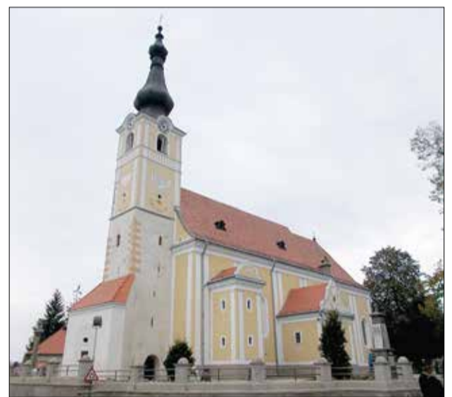
Gyergyóalfalu szépen felújított temploma