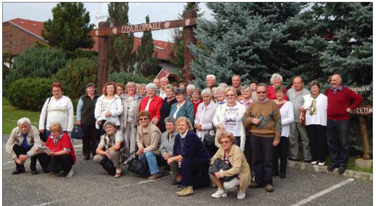
Indián nyárban kirándultak

Szakadó esőt hagytunk a Balatonnál, amikor október 15-én kirándulni indultunk Vas megyébe. Tervezőskor még nem tudtuk, hogy az országnak csak ezen a peremén lesz jó idő!