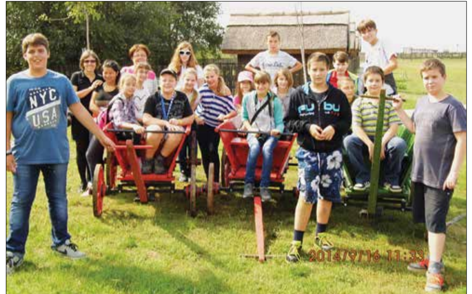
A hortobágyi pusztában nyári meleg fogadta a kirándulókat

A TÁMOP 3.1.4-12-2/2012-1316 számú pályázat támogatásával a hatodik osztály osztályfőnökével és az igazgató asszonnyal testvértelepülésünkön Ebesen tölthetett néhány napot. A gyerekek így emlékeznek erre a programra: