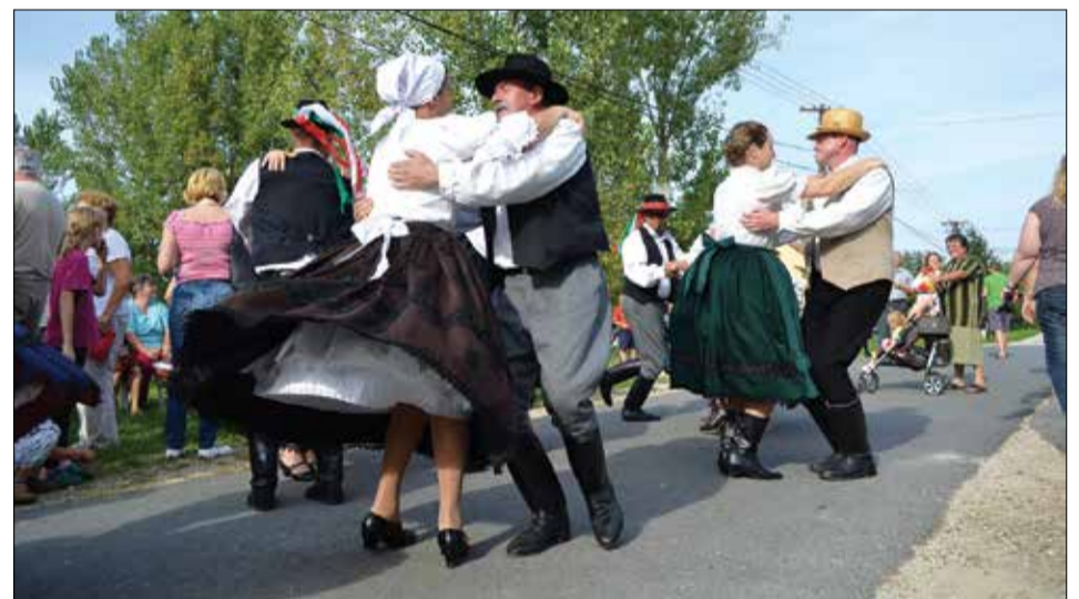
A közösséget is megforgatták a néptáncosaink