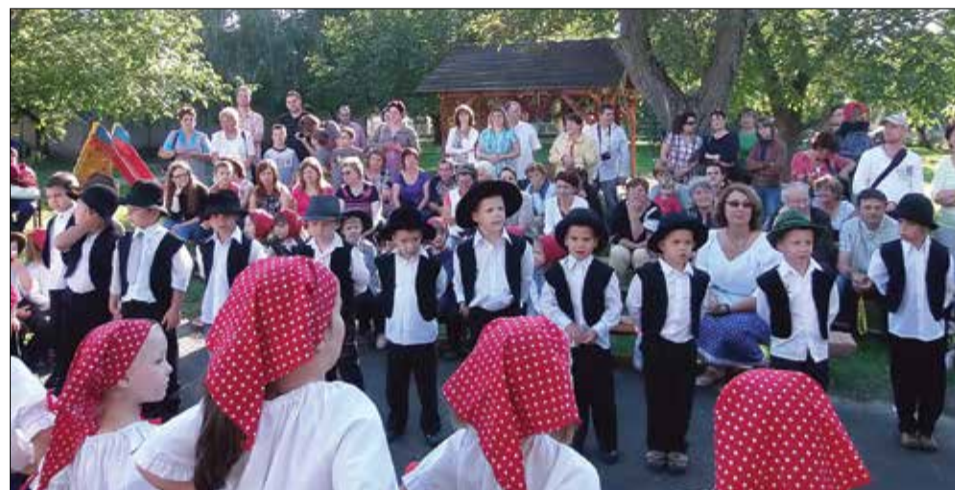
Mihály-napi rigmusokkal szórakoztatták a vendégeket

Igyekeztünk az udvarra varázsolni egy igazi vásári forgatógót. A vendégek megtekinthették, és vásárolhattak a szebbnél, szebb portékákból, és megkóstolhatták a finomabbnál finomabb süteményeket. Az eladásból befolyt összeg a csoportok pénzét gazdagította. Köszönjük segítőink, támogatóink jó szándékát, jó akaratát.