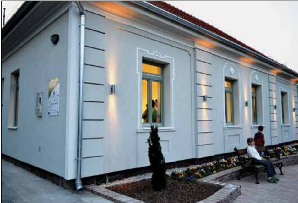
A megfiatalított épület díszkivilágítást kapott