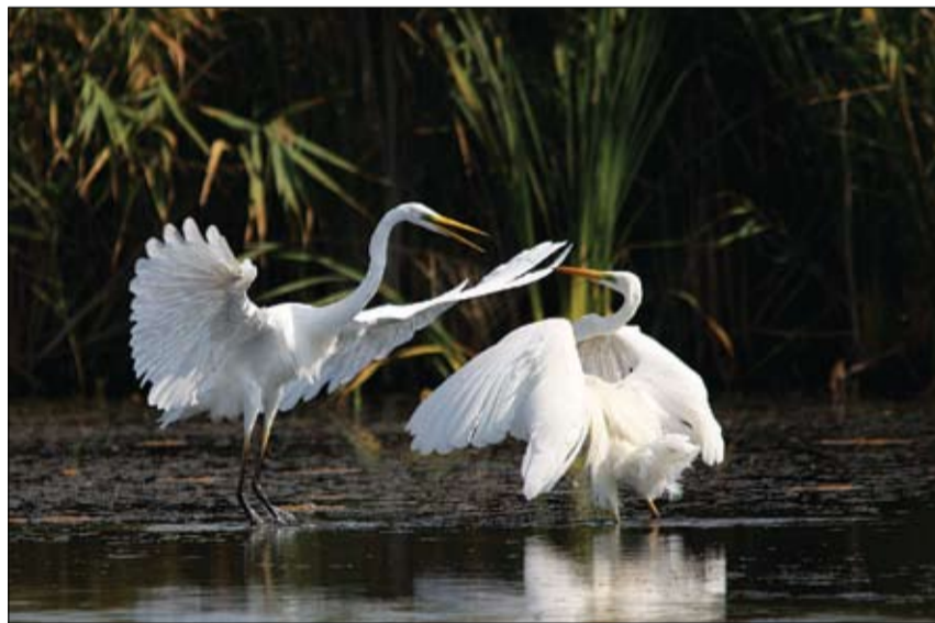
Ezt a pillanatot ki kellett várni, míg a gémek harcra emelik szárnyukat.

– ahol élni jó! – nem okozott gondot, mondta, de hogyan fogják ezt megjeleníteni a fiatalok? Nagy meglepetésre kitűnő képek születtek. És nem is kevés. A kétszáz beküldött alkotást, akár mind kiállíthatjuk volna, de ötvenet sikerült elhelyezni a polgármesteri hivatal aulájában. Kérte a résztvevőket, továbbra is szorgalmasan fotózzák Szárszó lakóit, természeti szépségeit, az itteni rendezvényeket, s a legjobb képeknek igyekszünk megjelenési lehetőséget biztosítani.