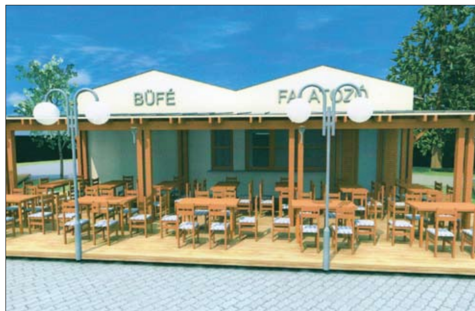
E látványterv alapján már az idén megkezdődik a Zenepavilon melletti vendéglátóhelyek építése.