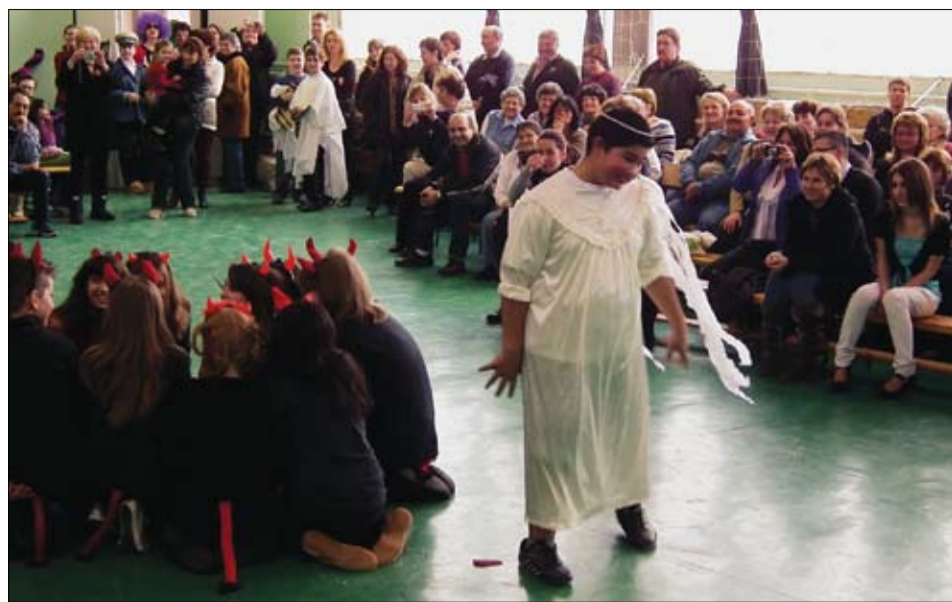
Az Ördögök és angyalok című produkció nagy sikert aratott a farsangolók körében.