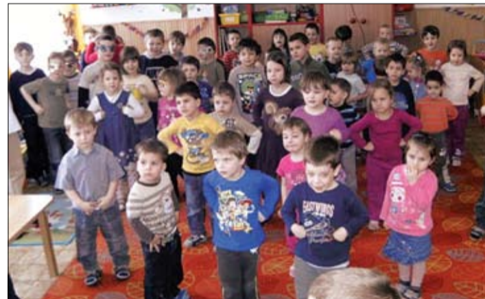
Az óvodások is sokat táncoltak a farsangi mulatságukon.

A rosszkedvet, betegséget jelképező kiszababot a Piac téren semmisítettük meg, vagyis bedobtuk a patakba. Ezt a néphagyományt már jól ismerik a gyerekek. Mindhárom cso-