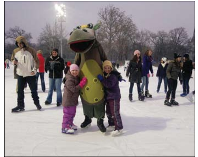
Süsü nem fázott a fővárosi Műjépgályán.

Január, február, itt a nyár. Nekünk, a turizmussal, a vendégvárással foglalkozóknak, még hamarabb elkezdődik. A kiadványok, vendégcsalogató prospektusok előkészületeit, a műsoros rendezvények az időpont egyeztetéseit, a nyomdai megrendeléseket szinte már az új év másnapján beindítjuk. A napokban pedig a nagyközönség szinte készen tálalva kapja a kínálatot az egész országból. Mi is nagy erőbedobásra készülünk, hiszen a tavalyi, rendkívül sikeres szezonban szinte az egész ország felfigyelt arra, hogy mi mindent újítottunk, mennyi újdonságot kínáltunk Balatonszárszón, természetesen a csodás Balatonon túl.