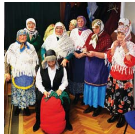
NABE-s bábuskák nagy sikert arattak a répa mesével

Nagyon népszerűek a szárszói polgárőrök. Biztosan, azért, mert jól vigyáznak ránk. A gyors statisztika szerint kétszer annyian vettek részt a farsangi báljukon február 23-án, mint egy évvel korábban. Sőt, két önkéntes csoport is gondoskodott a bálózók szórakoztatásáról. Az egyik a tavaly már nagysikerrel fellépő Pálcikáék, akik most szinkronúszó csapatban mutatták meg fergeteges képességeiket, mindezt víz nélkül elbeszélve. A Nők a Balatonért Egyesület helyi csoportja is készült. Ők 18 éven felülieknek játszották el a réparól szóló mesét.