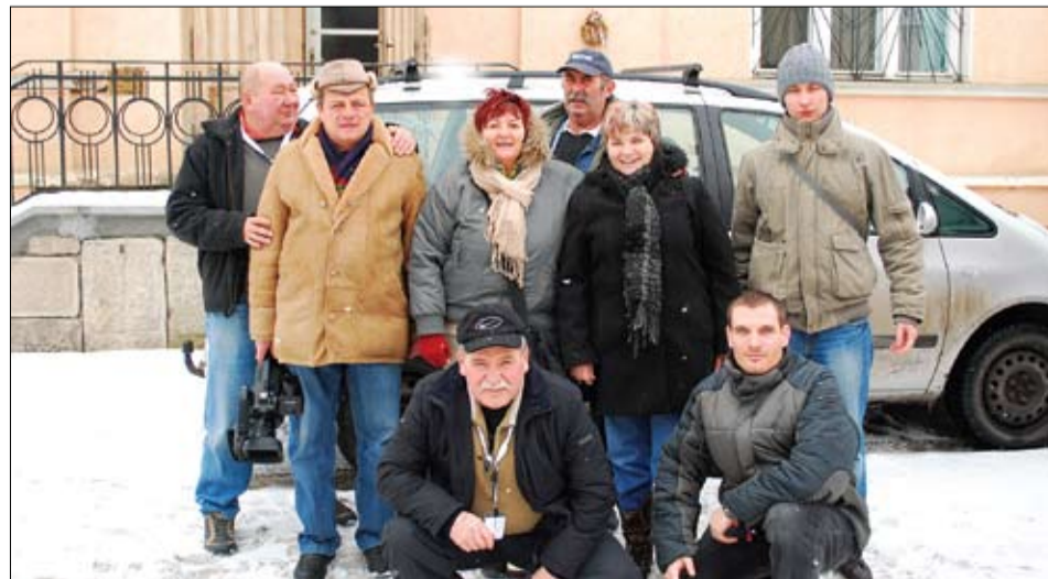
A szárszói csapat a gyergyóalfalui polgármesteri hivatal bejáratánál.