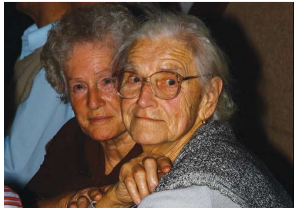
A nyugdíjasokra, az egyedül élőkre, az ápolásra szorulóakra sok gondot fordít az önkormányzat.

talékunk. Megköszönte az üdülőtulajdonosoknak, hogy adóforintjaikkal hozzájárulnak a jó pénzügyi helyzethez, és az idegenforgalmi adó bevétel is kedvezően alakult. A fizetési morál javulásához talán az is hozzájárult, hogy látják a tulajdonosok, hogy a település vezetői nagy