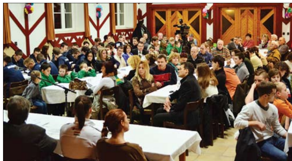
A sportolók a közgyűlés után együtt vacsoráztak.