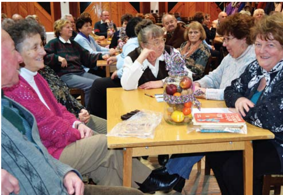
A játékban résztvevő nyugdíjas pedagógusok csapata.