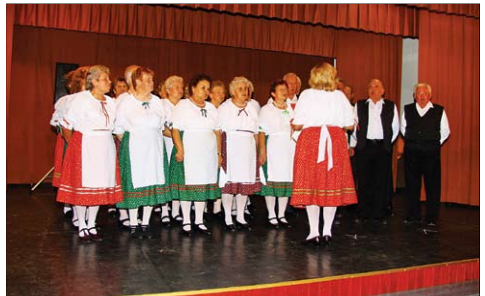
A Nyugdíjas Dalkör vidám magyar nótákat énekelt.