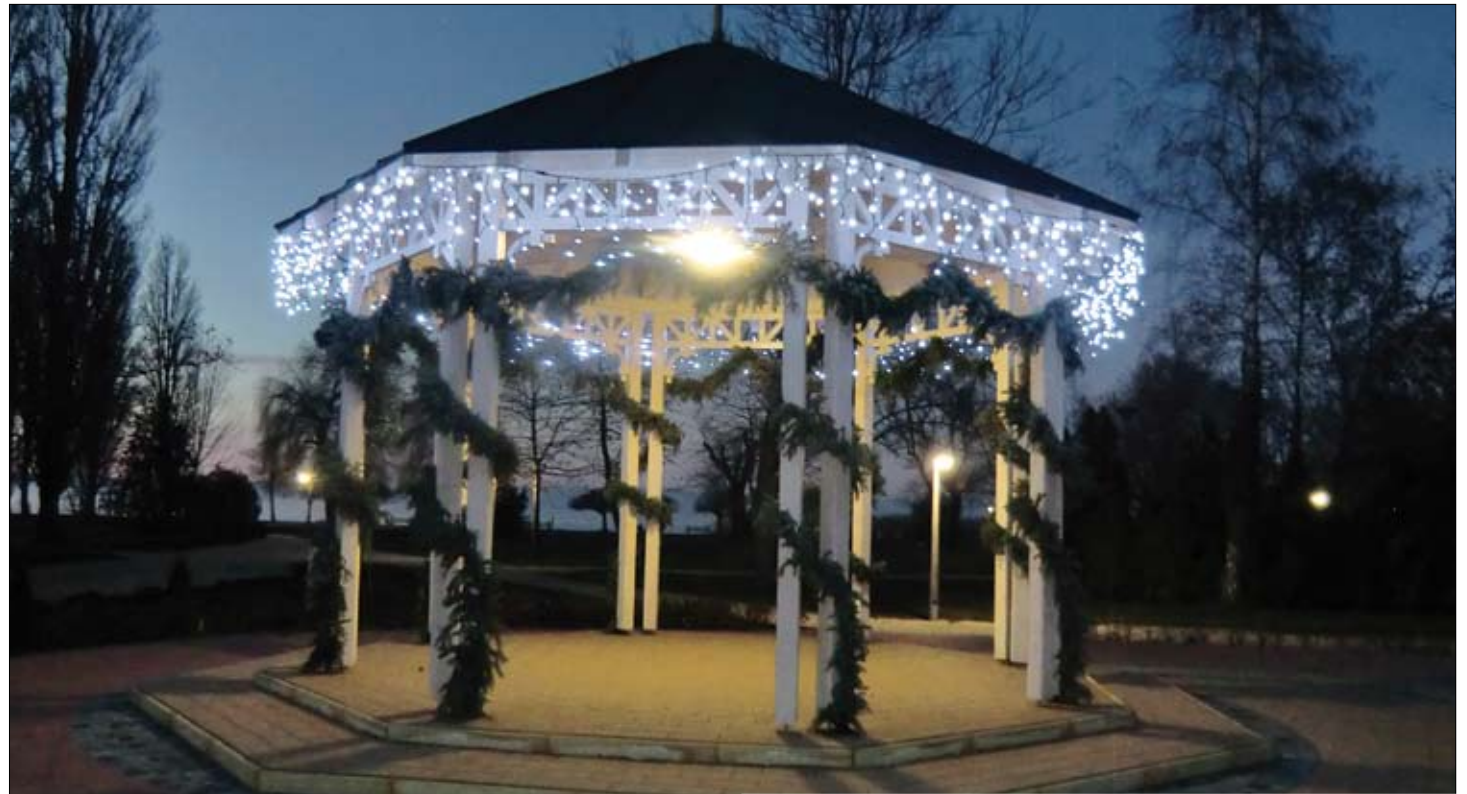
Az ünnepőbe öltözött, felkészezett Zenepavilont sokan megcsodálták az ünnepek hetében.

A dvent első vasárnapjára ünnepi díszbe öltözött Szársz. Am a készülődés már hetekkel korábban elkezdődött. Valójában a településünk apraja, nagyja hozzájárult, hogy lélekben – versekkel, énekekkel, zeneszóval és dekorációval készüljön az év legszebb ünnepére. Az első adventi vasárnapon, a református templomban az általános iskola zenetagozatos tanulóinak ünnepi műsorával kezdődött. Folytatódott a Polgármesteri Hivatal aulájában a program azáltal a kiállítással, amelyet intézmények és civil szervezetek tagjai készítettek, bemutatva, mit tartanak fontosnak a szeretet ünnepén. Valóságos ötletparádában volt része a közönségnek.