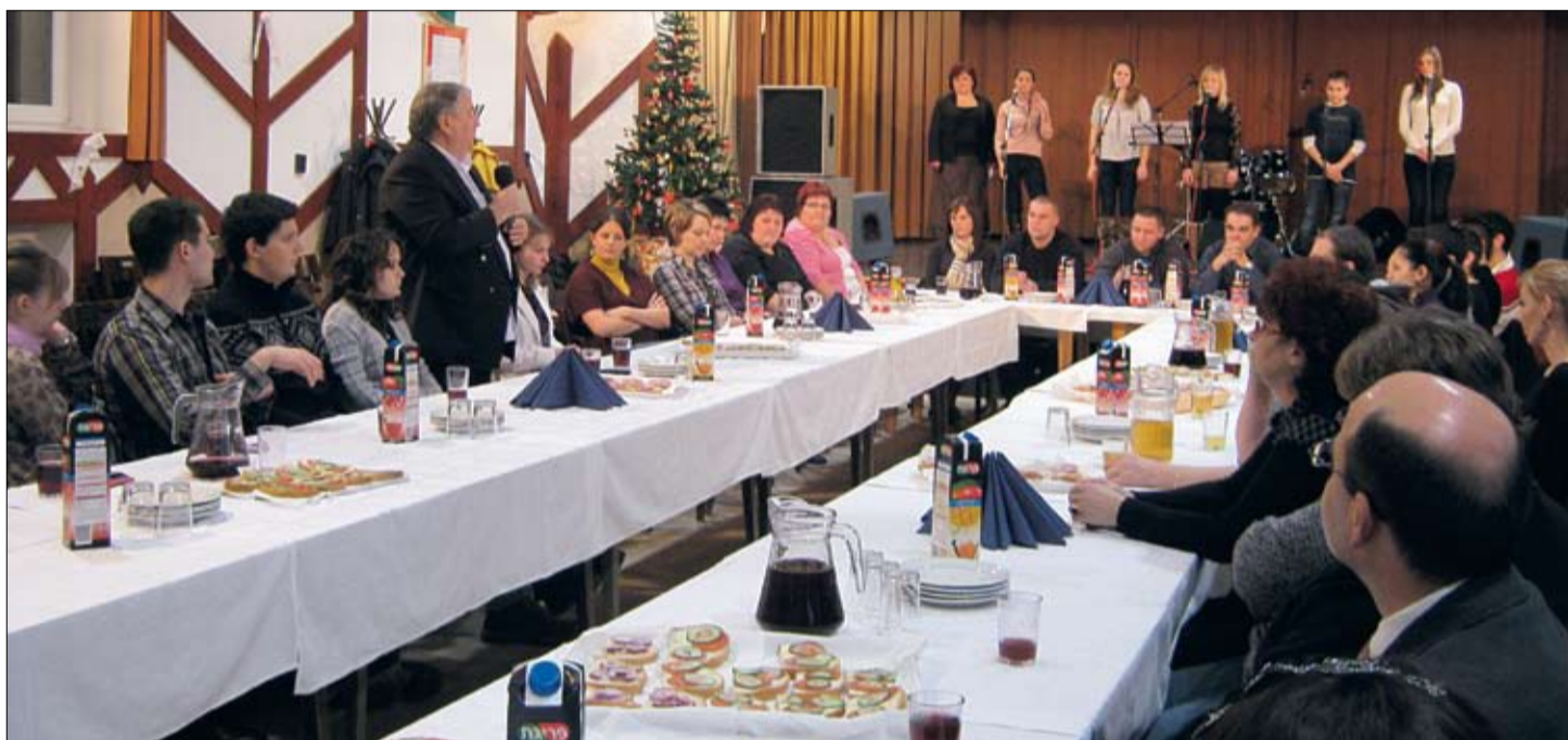
A polgármester köszöntötte a fiatalokat, akinek még a gitárjára is szükség volt e jó kis buliban.

Büsszel és Berlin, Budapest, Szeged, Pécs többek között innen érkeztek haza azok a fiatalok, akik eljöttek december 27-én a polgármesteri meghívásra, hogy a karácsony, a szeretet ünnepén itt is és így is örüljenek egymásnak. És persze, ott voltak szép számmal a helybeli fiatalok, akik ugyancsak örültek, hogy a képviselők figyelnek, számítanak rájuk. Sokan levélben köszönték meg a meghívást, de a vizsgaidőszakra, vagy családi kötıtségre, a távolságra hivatkozva nem tudtak eljönni az összejövetelre, de várják a következő alkalmat.